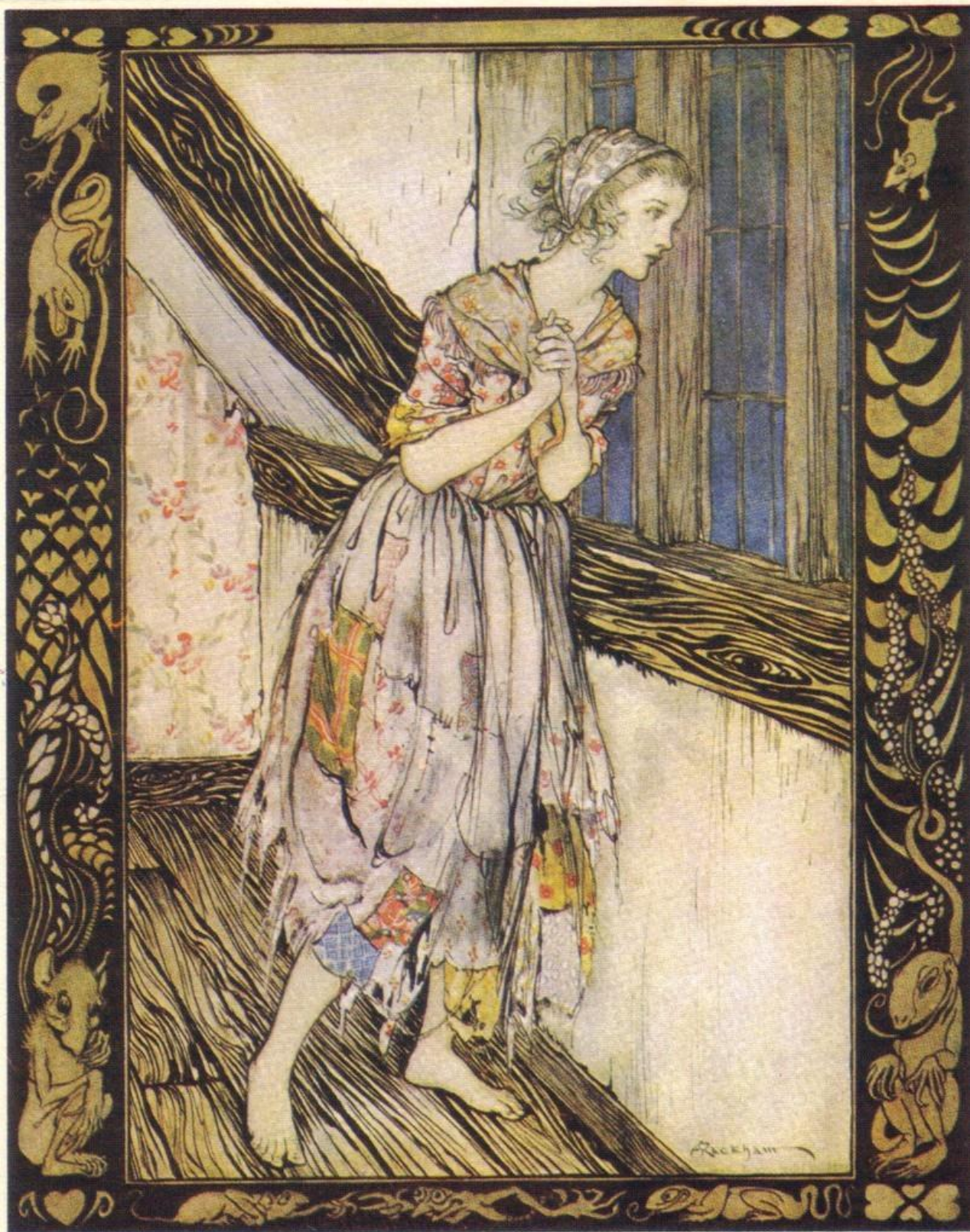
Illustration d'Arthur Rackham pour la version des frères Grimm « Ashenputtel » http://la-princesse-meduse.fr/cendrillon-en-images/