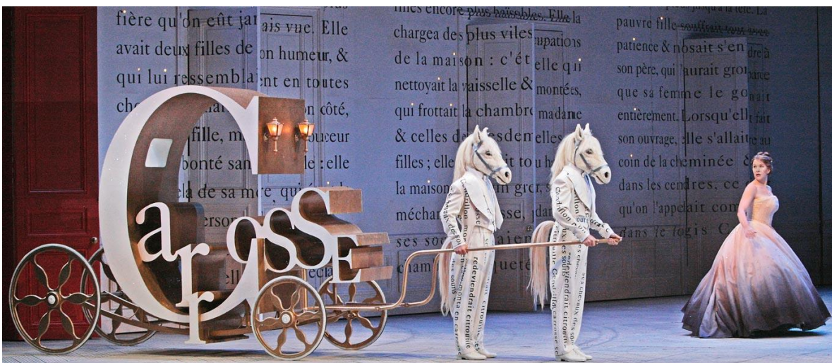
Cendrillon au Met Opéra de New York

https://www.dansesaveclapume.com/en-scene/33388-cendrillon-de-christopher-wheeldon-par-le-het-nationale-ballet-percutant-et-feerique-2/