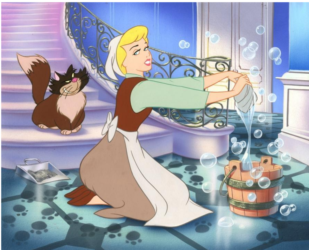
Illustration tirée du dessin animé de Walt Disney. http://la-princesse-meduse.fr/cendrillon-en-images/