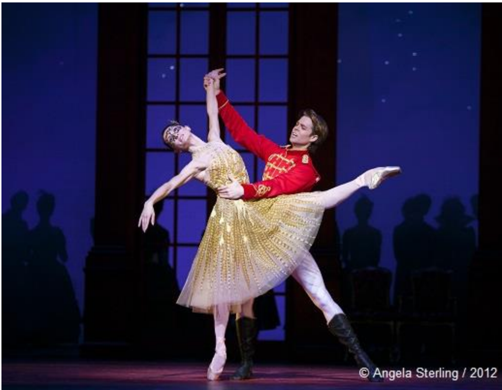
Cendrillon de Christopher Wheeldon par le Het Nationale Ballet au London Coliseum

https://www.dansesaveclapume.com/en-scene/33388-cendrillon-de-christopher-wheeldon-par-le-het-nationale-ballet-percutant-et-feerique-2/