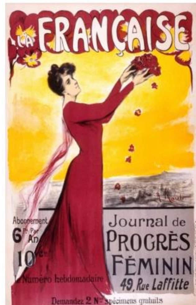
La Française , Alice KAUB-CASALONGA, 1906 Lieu de Conservation : Bibliothèque de documentation internationale contemporaine / MHC site web Gilles Chamayou 2017