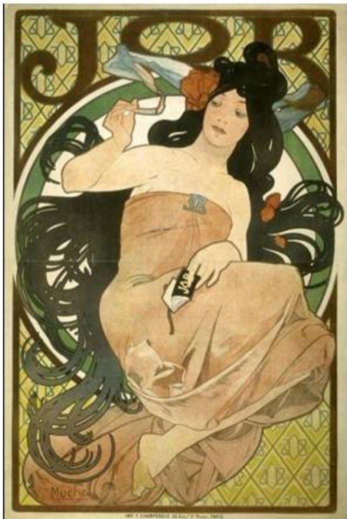
JOB , Alfons MUCHA, 1898 ( Hauteur 150 - Largeur 101) Lithographie en couleur Lieu de Conservation : Musée de la publicité site web